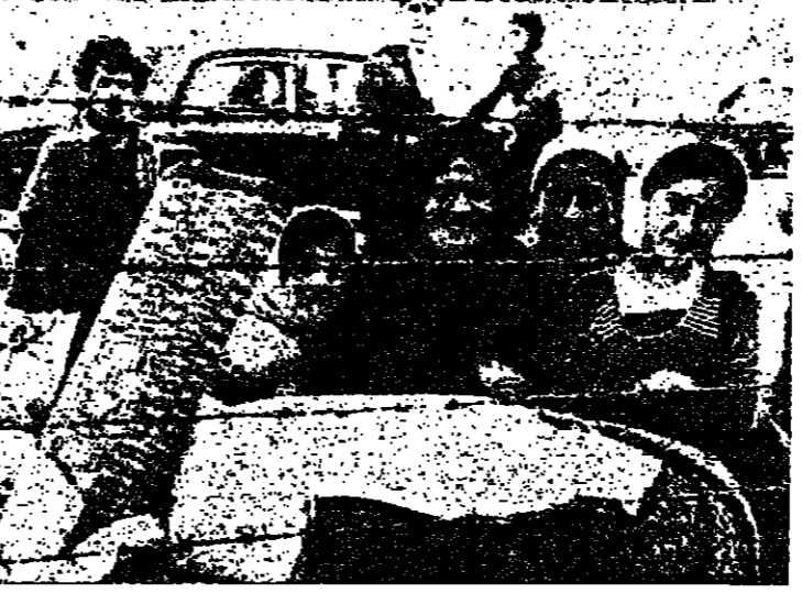
بانتظار لحظة العودة

عمان - واف - قدمت جماعة الضفط العربية في الولايات المتحدة شكوى ضد الحكومة الاميركية تطلب فيها يوقف شحنات الاسلحة الاميركية الى اسرائيل . جاء ذلك في تصريح ادلى به لوكالة الانباء الفرنسية هشام شرابي احد الاعضاء المؤثرين في جماعة الضفط العربية في الولايات المتحدة والاساذ بجامعة جورج تاون . وادّعى شرابي ان هذه الشكوى التي قدمت الى احد المحاكم الاميركية لتتهم اسرائيل بانتهاك اتفاقية التسلم المبرم مع الولايات المتحدة وذلك باستخدامها القنابل العنقودية ضد السكان المدنيين في جنوب لبنان . وقالان جماعة الضفط العربية تتداول الان جمع الادلة اللازمة